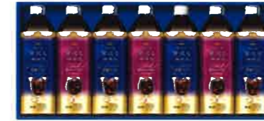
★AGFアイスコーヒーギフト