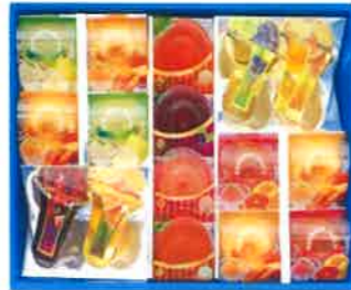
★デリシュ・ポヌール