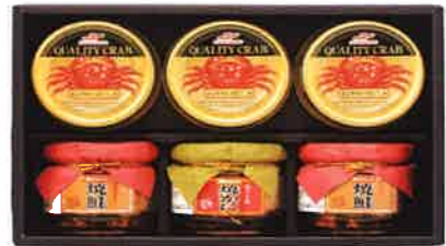
★かに缶詰・瓶詰詰合せ