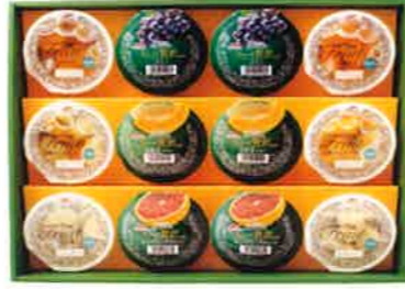
★マルハニチロ 果実たっぷりゼリー6種詰合せ