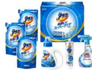
花王 アタック抗菌EXSPクリア ジェルギフト<KAK30>