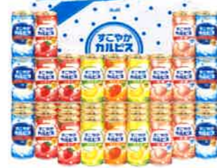
★すこやかカルピスギフト(45本)