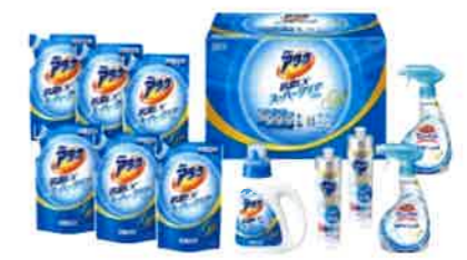
花王 アタック抗菌EXSPクリア ジェルギフト<KAK50>