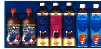
★AGFファミリー飲料ギフト