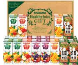
★カゴメ 野菜飲料バラエティギフト(40本)