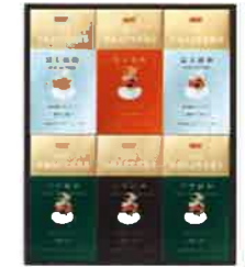
★UCC ザロースターズ(30杯)