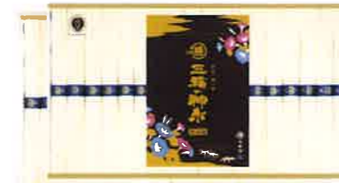
★マル勝高田 三輪の神糸 36束