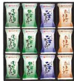
★アマノフーズフリーズドライ 味 わいづくしギフト (24食)