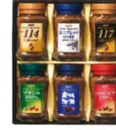
★UCCインスタントコーヒーギフト