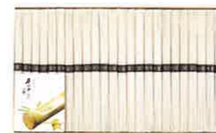
★島原手延そうめん 24束