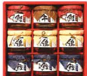
★あけぼの 瓶詰詰合せ <ABZ-50>