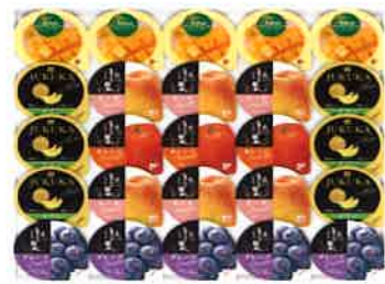
★バラエティフルーツゼリーギフト

※商品1個につき送料660円(税込)が含まれています。 ※発送はご注文確認の後、7～10日ほどかかります。 ※都合により品切れとなる場合がございますので予めご了承ください。 ※★印の商品は軽減税率対象商品です。 ご注文先 大分県労働福祉会館 TEL 097-533-1121 FAX 097-533-2130