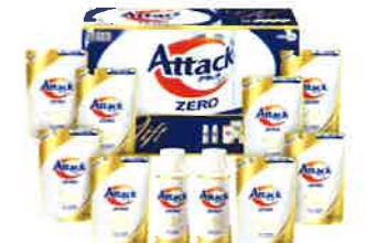
花王 アタックZEROギフト <K-AB-50>