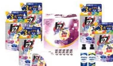
ライオン トップクリアリキッド 抗菌セット<LKS-30A>