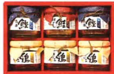
★あけぼの 瓶詰詰合せ <ABZ-30>