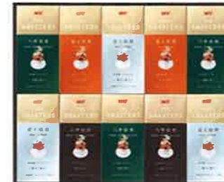
★UCC ザロースターズ(50杯)