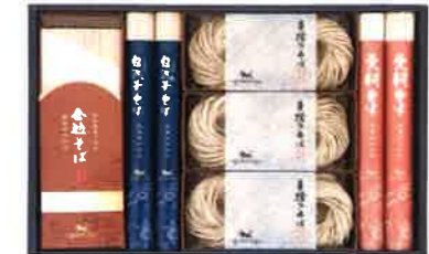
★自然芋そば 蕎麦食べ比べ