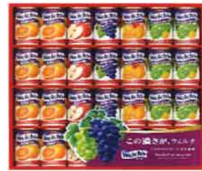
★ウェルチ100%果汁ギフト(28本)