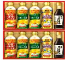
★日清 バラエティオイル& 丸大豆しょうゆギフト