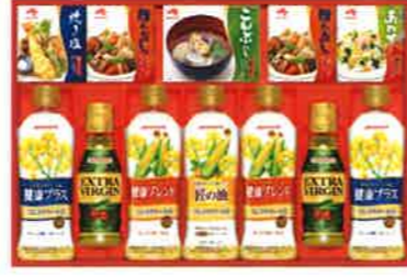
★味の素バラエティ調味料ギフト