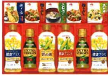
★味の素バラエティ調味料ギフト