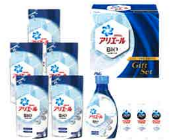
アリエール液体洗剤セット (PGCG-50A)