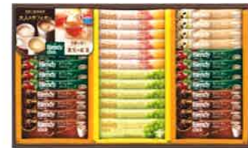
★AGFフレンジースティックアソートギフト