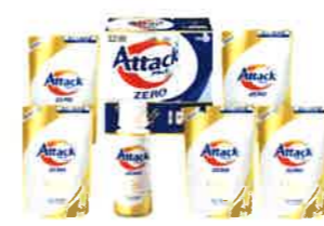
花王 アタックZEROギフト <K-AB-30>