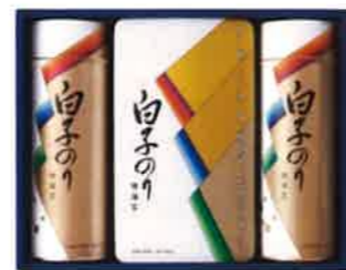
★白子のり のり詰合せ