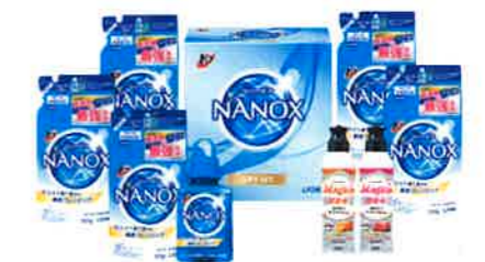
ライオン トップスーパー ナノックスセット<LNW-30>