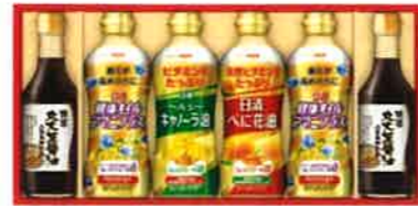
★日清 バラエティオイル& 丸大豆しょうゆギフト