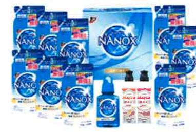
ライオン トップスーパー ナノックスセット<LNW-50>