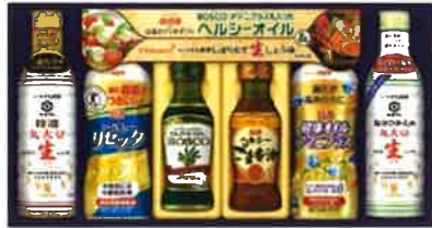
★日清 ヘルシーオイル& キッコーマン生しょうゆギフト