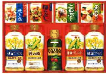
★味の素バラエティ調味料ギフト