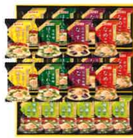
★マルトモ 鯉節屋のこだわり 椀 (22食)