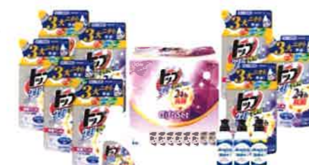
ライオン トップクリアリキッド 抗菌セット<LKS-50A>