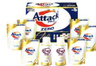
花王 アタックZEROギフト <K-AB-40>