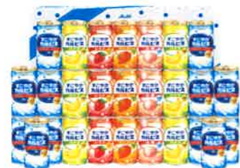
★すこやかカルピスギフト(27本)