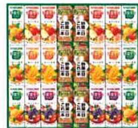
★カゴメ 野菜飲料バラエティギフト(24本)