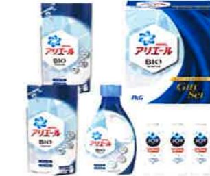
アリエール液体洗剤セット (PGCG-30A)