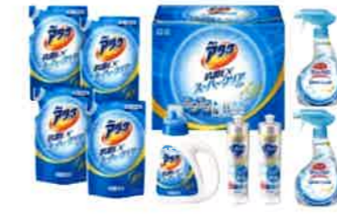
花王 アタック抗菌EXSPクリア ジェルギフト<KAK40>