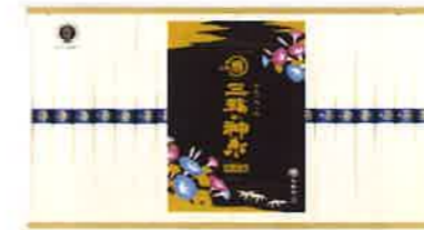
★マル勝高田 三輪の神糸 20束