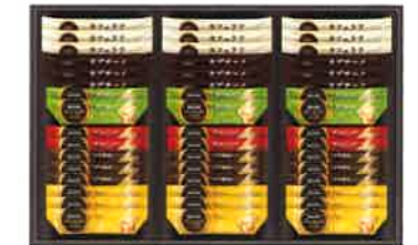
★ネスカフェGBプレミアムスティックコーヒー(48本)